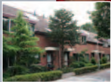
Ressort Wonen boekt positief resultaat in 2010