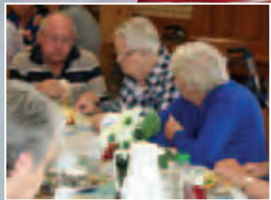
Weer leuke activiteiten voor huurders verschillende complexen